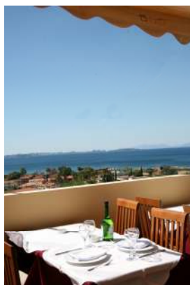
Το δείπνο εδώ θα γίνει πραγματική εμπειρία αισθήσεων..