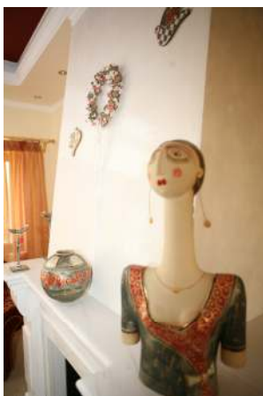
Στην πρώτη κιόλας επαφή με το χώρο ο επισκέπτης θα νιώσει την ζεστή φιλοξενία